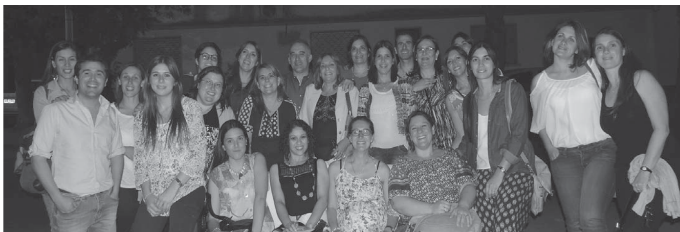
Agrupación de Psicólogos de Durazno