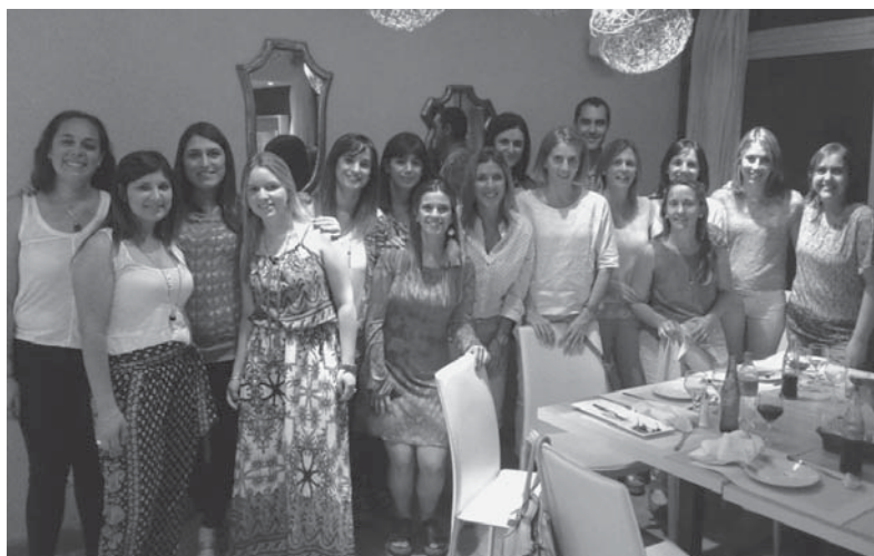
Agrupación de Psicólogos de Flores

Y por supuesto, agradecer también por todos los saludos recibidos de parte de particulares -socios y no socios- e instituciones colegas y amigas, en ocasión del Día del Psicólogo y por las fiestas tradicionales de fin de año.