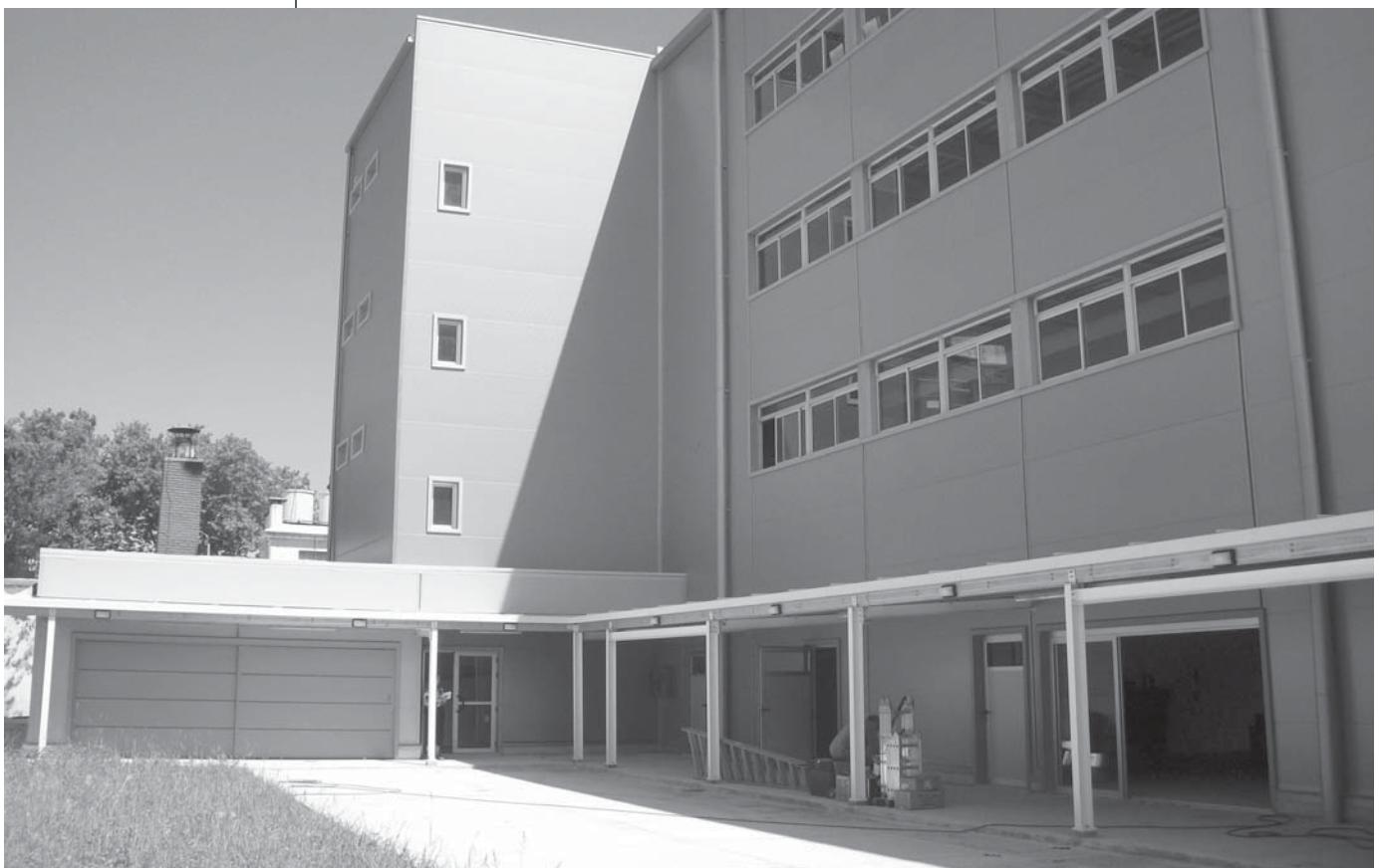
Fachada interior de la nueva sede que albergará a Psicología desde este año (Gral. Urquiza y Cte. Braga)

Cuando yo salí de Facultad, mi horizonte era buscar pacientes. Hoy no se preguntan eso, porque se pueden hacer 200 cosas con la psicología. Hemos evolucionado muchísimo en investigación, que ahora es el fuerte de la psicología en Uruguay y antes no lo era, era un poquito más tabú. Y tenemos gente que quiere ser investigadora y eso también cambió el perfil del psicólogo. Absolutamente. ♡