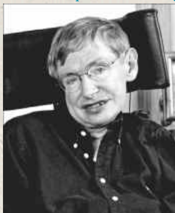
Profesor Stephen W Hawking

En el informe se formulan recomendaciones para la adopción de medidas a escala local, nacional e internacional. Por consiguiente, será una herramienta inestimable para las instancias normativas, los investigadores, practicantes, defensores de los derechos y los voluntarios relacionados con la discapacidad. Mi esperanza es que, a partir de la Convención sobre los Derechos de las Personas con Discapacidad , y ahora con la publicación del Informe mundial sobre la discapacidad , este siglo marque un giro hacia la inclusión de las personas con discapacidad en las vidas de sus sociedades.